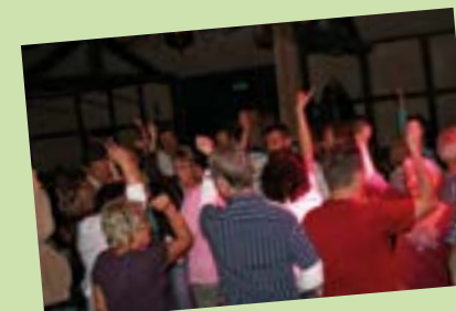
Tanzabend mit DJ