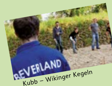
Kubb – Wikinger Kegeln